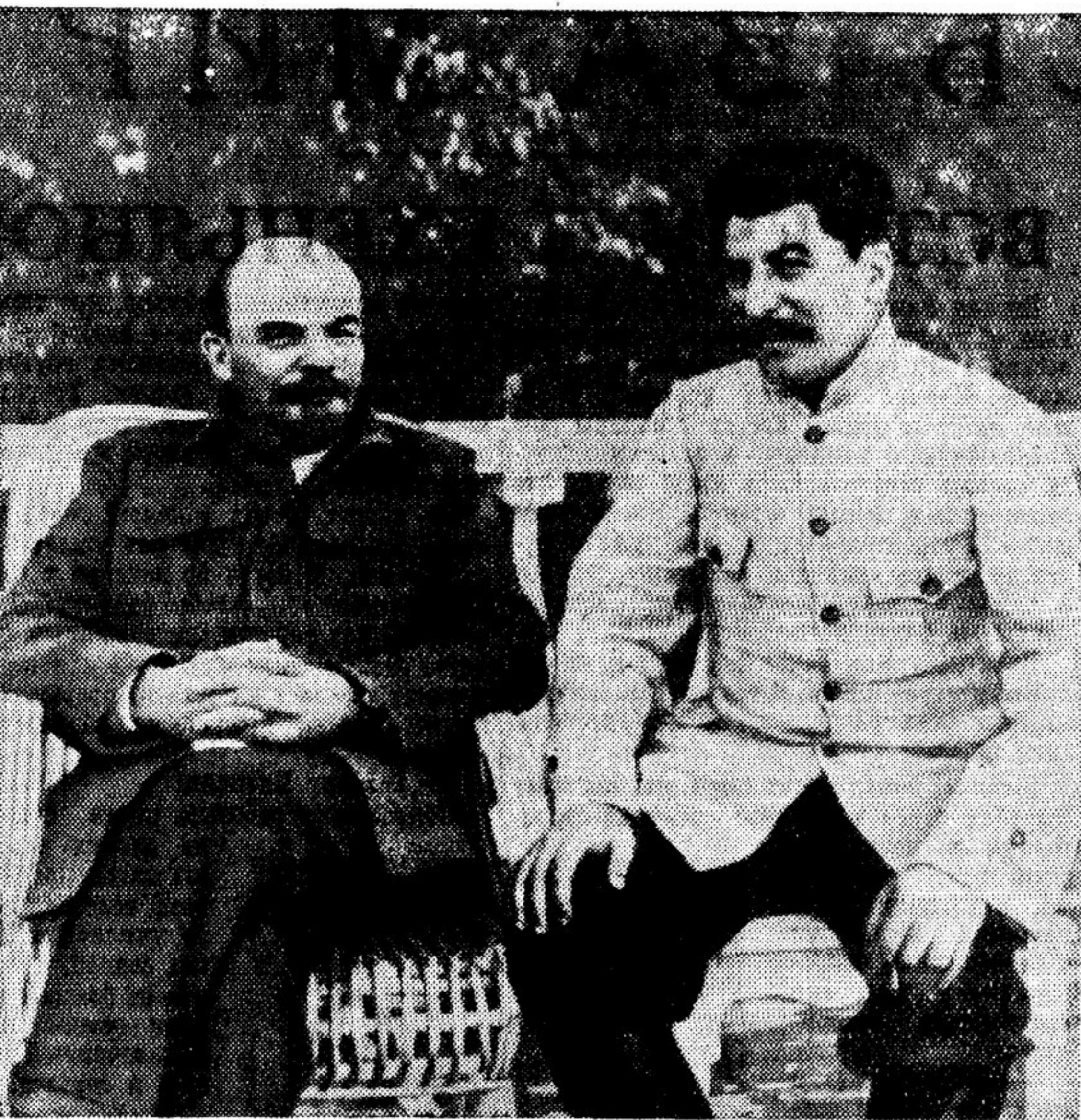
В. И. Ленин и И. В. Сталин в Горках. 1922 г.