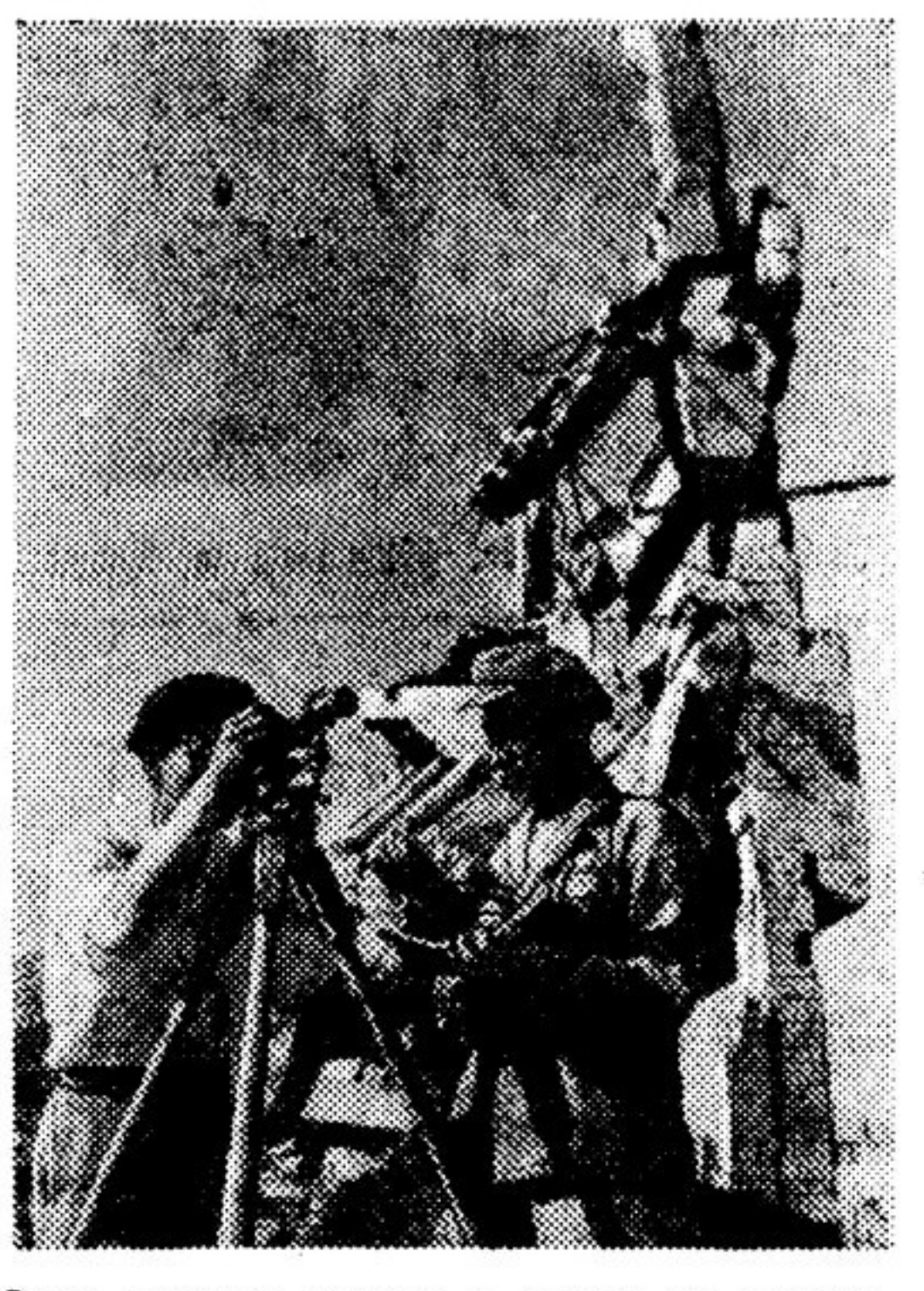
Этот снимок сделан в одном из северокорейских городов незаложенного перемирия. Голосисты производят съемку для предстоящих работ

Томительны были короткие недели времен неудач Народной армии, когда со всех концов страны двинулись к братским берегам Лягурия беженцы с суровыми, решительными лицами. И с кем бы мы ни говорили в эти горестные для корейцев дни, ни разу не почувствовали, что люди сложены, выбиты из колеи. Напротив! Полугодецы, с трудом вырвавшиеся из огня, лишившие своих близких, крова над головой, они не потеряли главного — веры в свой народ, в свою правоту. Покрасневшие глаза женщин сурово блестя, скорбящие, суровые складки леги у рта. Но все они уверенно говорили: — Скоро все изменится... Там, — вытягивали они свои худые руки в ту сторону, где грохотали оружейные залпы, — решится наша судьба. Там наши мужья, братья... Мы видели, как эти же самые женщины, еще не смыв пыли и копоти с лица и рук, восстанавливали в горах и на сопках заводы, строили подземные школы, под огнем чинили дороги и мосты, умирая под бомбами, как солдаты, орочали своей чистой кровью родную землю. ...Шестого декабря 1950 года мы снова встретились с Пхеньяном. В этот день части Народной армии и китайских добровольцев освободили город от захватчиков. Больно сказало сердце: не было улиц, еще недавно так любовно озелененных;